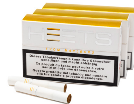
UNIÃO EUROPEIA (ALEMANHA)