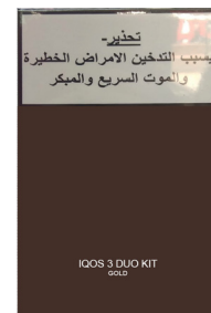
ISRAEL EMBALAGEM DO DISPOSITIVO DE AQUECIMENTO