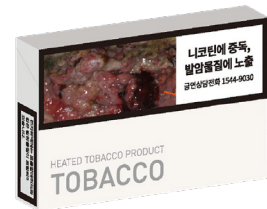
REPÚBLICA DA COREIA