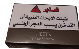
ISRAEL CIGARROS AQUECIDOS